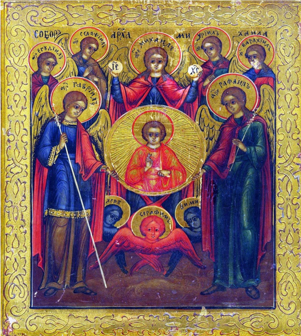
Русь: Рада Небесних Сил XIX століття. темпвра на дереві

Істоти двох вищих тріад не входять у земний світ. Натомість ангели найнижчої тріади, найближчі до людей, діють як посланці божественної волі, несучи Божі наміри у світ